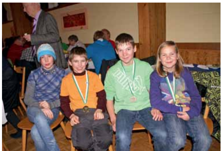
Der erfolgreiche Nachwuchs aus St. Oswald.