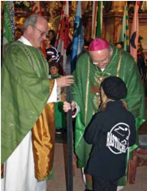
Begegnung einer Rastbüchler Athletin mit Bischof Wilhelm Schraml und dem Geistlichen Beirat des DV Passau, Hans Wagenhammer.

Mit einem Festgottesdienst wurden die 10. Bundeswinterspiele 2011 des DJK-Bundesverbandes abgeschlossen. Mit herzlichen Worten bedankte sich der Diözesanvorsitzende Klaus Moosbauer bei Bischof Wilhelm Schraml für dessen großes Herz für die DJK und überreichte ihm am Ende des Gottesdienstes ein DJK-Lebkuchenherz.