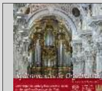
CD Spätromantische Orgelmusik Domorganist Ludwig Ruckdeschel