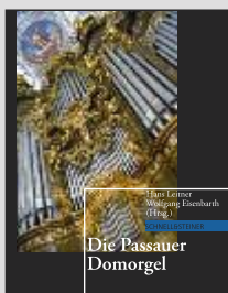
Das Buch zur Domorgel