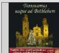
CD Transeamus usque ad Bethlehem Festliche Chor und Weihnachtsmusik