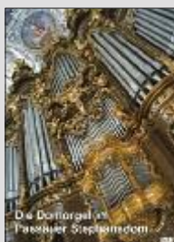
Die Domorgel im Passauer Stephansdom DVD – 19 Min.

Diese Artikel sind neben vielen anderen erhältlich im Kiosk im Dom (neben dem Hauptportal) im Domladen, Domplatz 7 (gegenüber vom Dom) +49 (0) 851 393 51 71 im Online-Shop unter www.domladen.bistum-passau.de