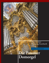
Das Buch zur Domorgel