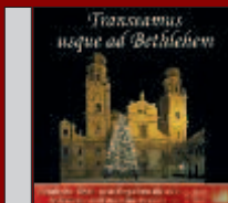
CD Transseamus usque ad Bethlehem Festliche Chor und Weihnachtsmusik