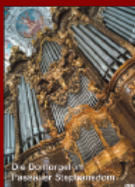
Die Domorgel im Passauer Stephandom DVD - 19 Min.

Diese Artikel sind neben vielen anderen erhältlich