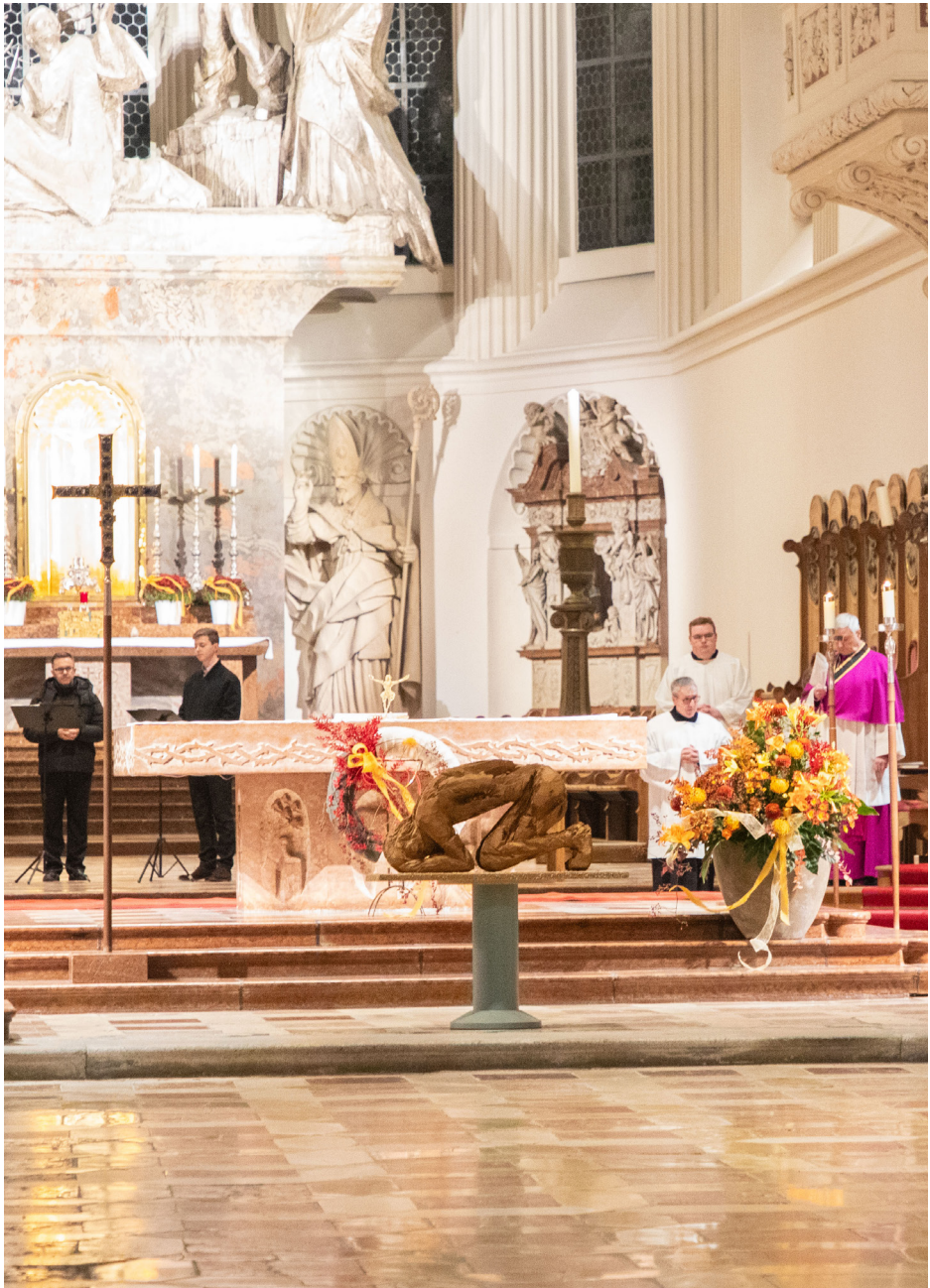
Der Gebetstag für Betroffene des sexuellen Missbrauchs 2023 im Dom. Seit 2019 findet dieser Gedenktag jährlich im Bistum Passau statt.