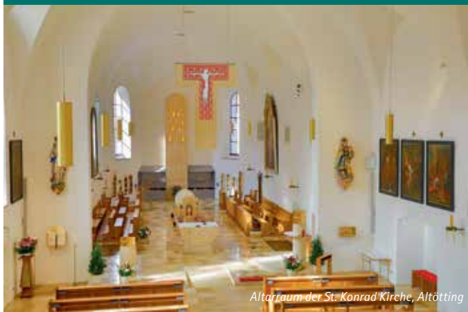
Altarraum der St. Konrad Kirche, Altötting