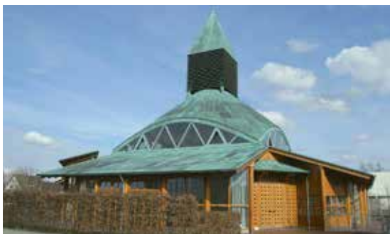
Kirche „Zum Guten Hirten“

Gebaut 1995 und geweiht 1996, ist die Kirche durch ihre Architektur besonders bemerkenswert. Die Bänke sind in Kreisform angeordnet, der Altar ist in diesen Kreis mit einbezogen. Sein „ungeschliffenes“ Aussehen durchbricht die Fülle an geometrischen Formen, die die Kirche prägen. Der Kirchenraum ist die Mitte des Gemeindezentrums, die Gemeinderäume sind ringsum angeordnet.