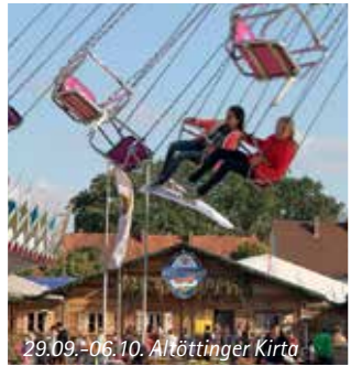
29.09.-06.10. Altöttinger Kirta