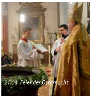
21.04. Feier der Osternacht