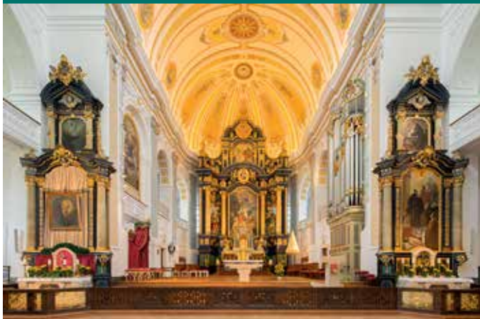
Basilika St. Anna