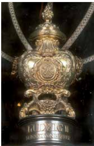
Herzurne König Ludwigs II.

Der Kapellen-Umgang ist mit rund 2.000 Votivtafeln aus mehreren Jahrhunderten ausgekleidet. Diese sind vom Zyklus der mehr als 50 großformatigen „Mirakeltafeln“ zu unterscheiden, die aus der ersten Hälfte des 16. Jahrhunderts stammen.