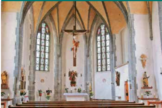
Kirche St. Michael