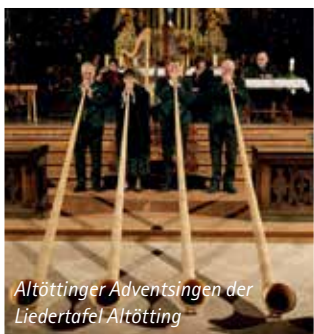
Altöttinger Adventsing in der Liedertafel Altötting