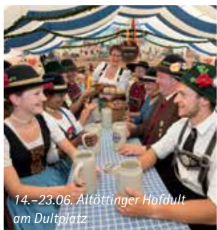
14.-23.06. Altöttinger Hofdult am Dultplatz