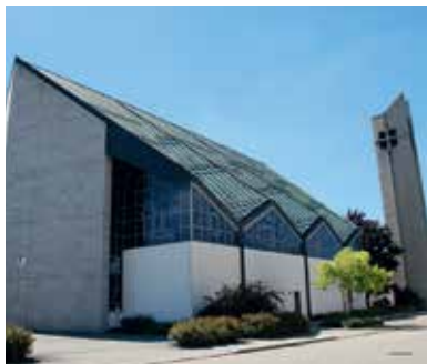
Anbetungskirche Hl. Kreuz