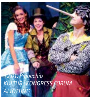
12.01. Pinocchio KULTUR+KONGRESS FORUM ALTÖTTING