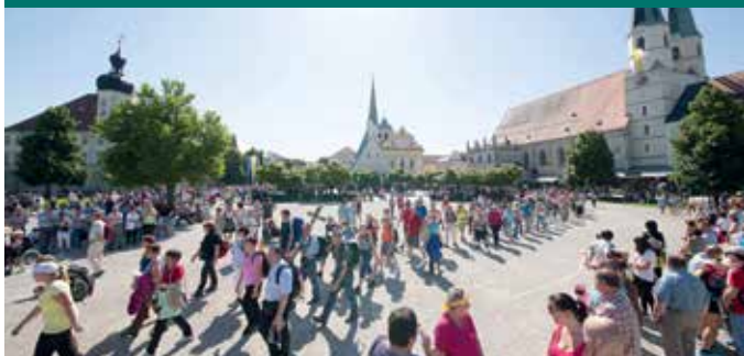
Pilgereinzug am Kapellplatz