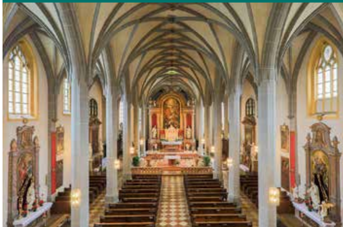
Die gotische Stiftspfarrkirche