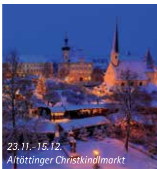
23.11.-15.12. Altöttinger Christkindlmarkt