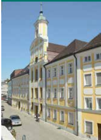
Kirche Congregatio Jesu