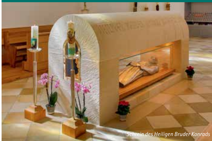
Schrein des Heiligen Bruder Konrads

die Fingerreliquie. Zur Verehrung des Heiligen können die Kirchenbesucher und Wallfahrer direkt an dieses Grabmal kommen und in unmittelbarer Nähe auch eine Opferkerze entzünden. Der Zugang dazu ist bewusst behindertengerecht gestaltet, an Stelle der Altarstufe gibt es eine schiefe Ebene.