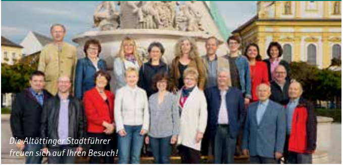
Die Altöttinger Stadtführer freuen sich auf Ihren Besuch!