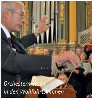
Orchestermessen in den Wallfahrtskirchen