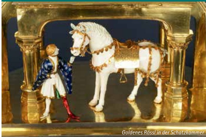
Goldenes Rössl in der Schatzkammer

Die Kunstschätze Altöttings lassen sich am besten mit einem geschulten Experten erkunden. Zu ausgewählten Themen gibt es kombinierte Stadt- und Museumsführungen in denen die Altöttinger Geschichte und der Kunstreichtum lebendig werden.