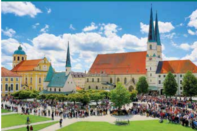
Der Kapellplatz von Altötting