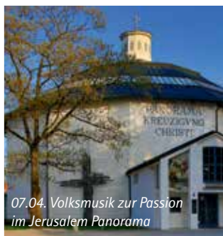
07.04. Volksmusik zur Passion im Jerusalem Panorama