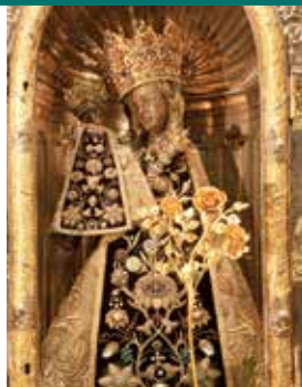
Das Gnadenbild Unserer Lieben Frau mit der Goldenen Rose

störung. Es vergingen drei Jahrhunderte, bis der Wittelsbacher-Herzog Ludwig der Kelheimer 1228 das Chorherrenstift wiedererrichten ließ. Anstelle der Karlmann-Basilika wurde eine neue Basilika im romanischen Stil erbaut. Im Jahr 1489 schlug die Geburtsstunde der Wallfahrt nach Altötting : Berichte von zwei aufsehenerregenden Heilungswundern ließen bald Pilger aus ganz Europa nach Bayern strömen. Ziel war und ist bis heute das aus Lindenholz geschnitzte Marienbild im Oktogon der ehemaligen Taufkapelle, das um 1330 nach Altötting gekommen sein dürfte. Der unglaublich große Pilgerstrom macht einen Kirchenneubau notwendig: Zwischen 1499 und 1511 entstand die heutige gotische Stiftskirche, auch das Oktogon der Kapelle erhielt ein Langhaus. Nicht nur das einfache Volk zieht es seitdem nach Altötting, die „Großen der Welt“ verleihen dem Wallfahrtsort auch eine politische Bedeutung. Für die Wittelsbacher Herrscher war Altötting fortan und bis ins 20. Jahrhundert hinein eine „Herzensangelegenheit“: Die Herzen der verstorbenen Herrscher wurden in silbernen Urnen im Oktogon der Kapelle in Wandnischen beigesetzt – sozusagen als „fürstliche Ehrenwache“.