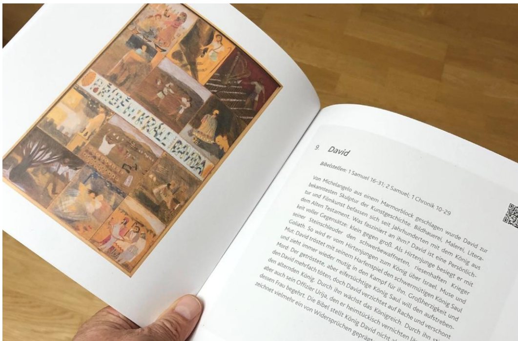
Der Ausstellungskatalog enthält zu jedem Bild den zugehörigen Bibeltext samt theologischer Hinführung.

Für die Ausstellung wurde ein Katalog gedruckt, in dem zu jedem gezeigten Bild eine theologische Hinführung die biblische Erzählung erklärt und einordnet. Der Künstlerin war es ein Anliegen, dass die zu den Bildern gehörenden Bibeltexte für die Besucher verfügbar sind, daher wurde jedes Bild im Katalog und in der Ausstellung mit einem QR-Code versehen, über den die jeweiligen Bibelstellen gewissermaßen aufgeschlagen werden können. Der QR-Code hat den Besuchern der Ausstellung und den Lesern des Kataloges so einen einfachen Zugang zur Bibelstelle eröffnet, so dass der Zusammenhang zwischen Bild und Bibeltext mühelos hergestellt werden konnte.