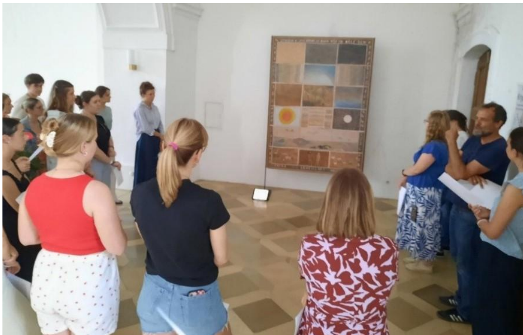
Studierende besuchen die Ausstellung im Rahmen eines Seminars der Universität Passau.