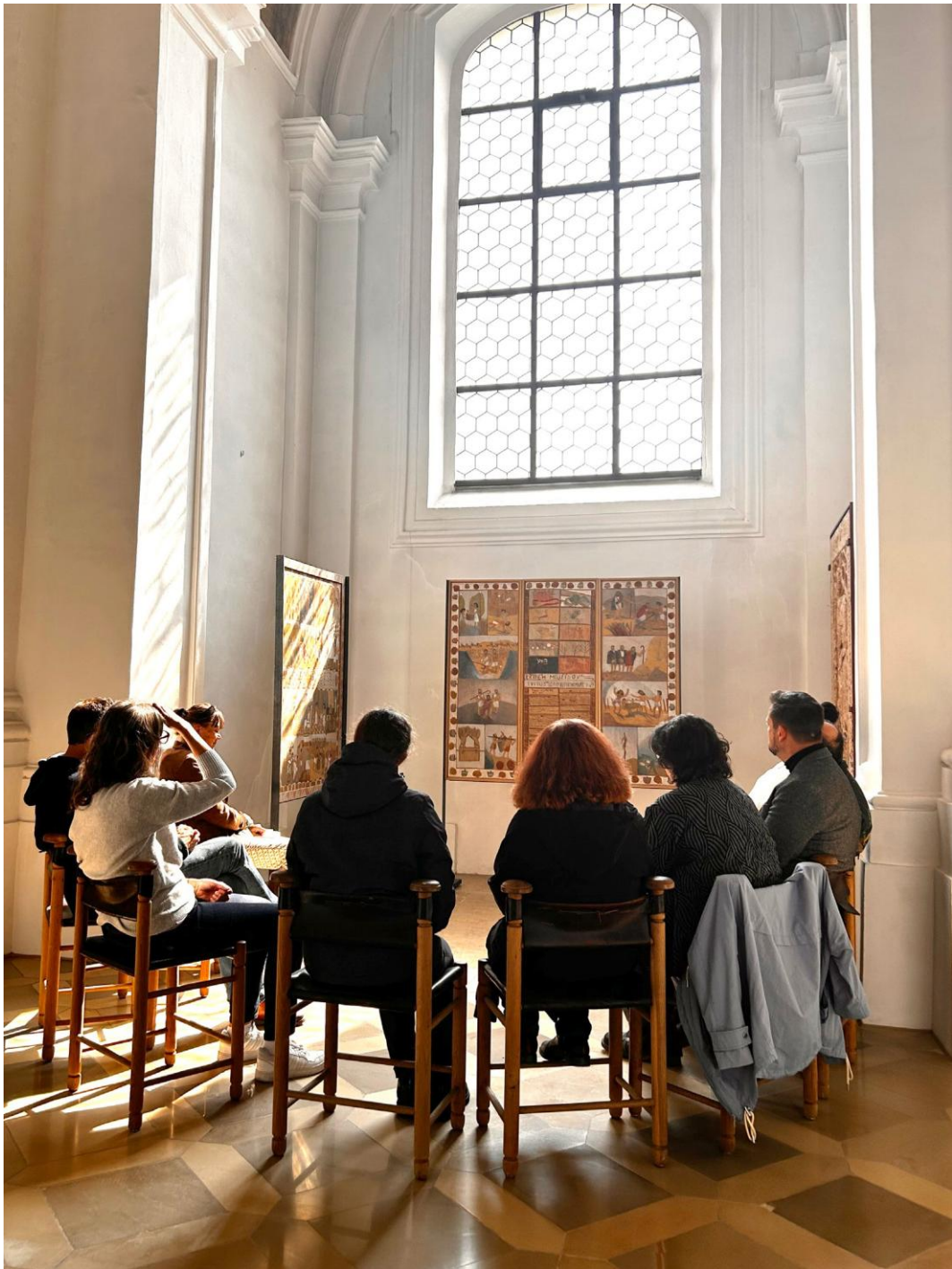
Meditative Mittagspause in der Fastenzeit.