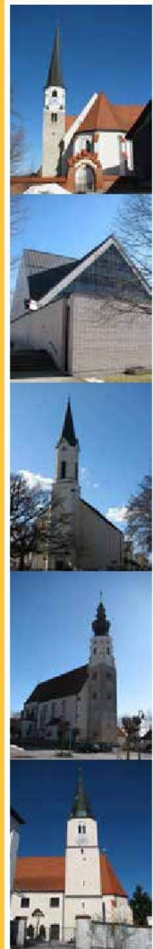
St. Marien - Dreifaltigkeit - Eggstetten - Erlach - Kirchberg