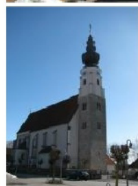
St. Marien - Dreifaltigkeit - Eggstetten - Erlach - Kirchberg