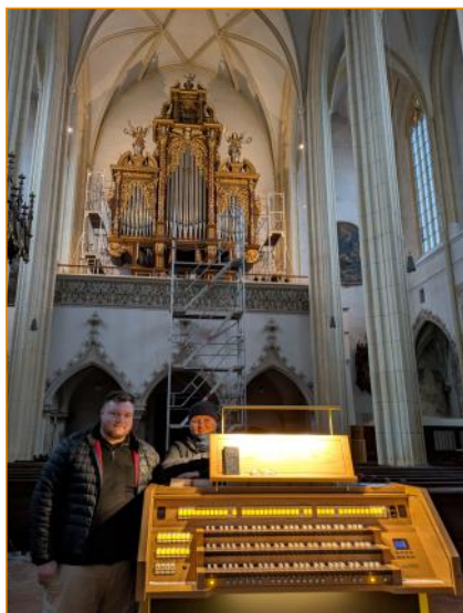
Orgelbauer der Firma Kisselbach beim Feintuning. Die Orgel kann im ganzen Kirchenraum mithilfe eines Podests bewegt werden.