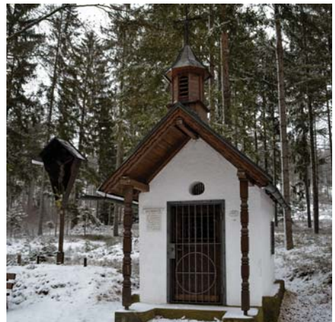
Die Glasmacherkapelle mit Kreuz