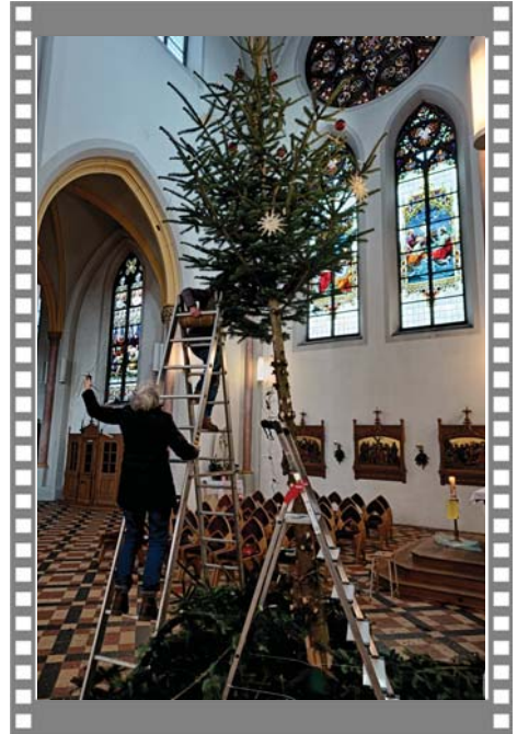
Der Christbaum steht. Und der Christbaum geht.