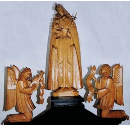
Heiligengruppe von Hans Schwarzer