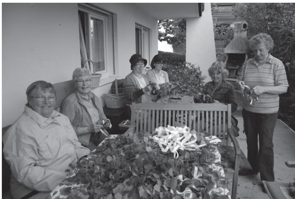
Beim alljährlichen Fronleichnamskranzbinden

Das vorliegende Jubiläum werden wird am Mittwoch, 12. September 2018 im Rahmen eines festlichen Gottesdienstes in der Bergkirche in Zwiesel feierlich begehen. Daran schließt sich eine interne Feier mit den Mitgliedern im Pfarrzentrum (Max-Brechenmacher-Haus) an.