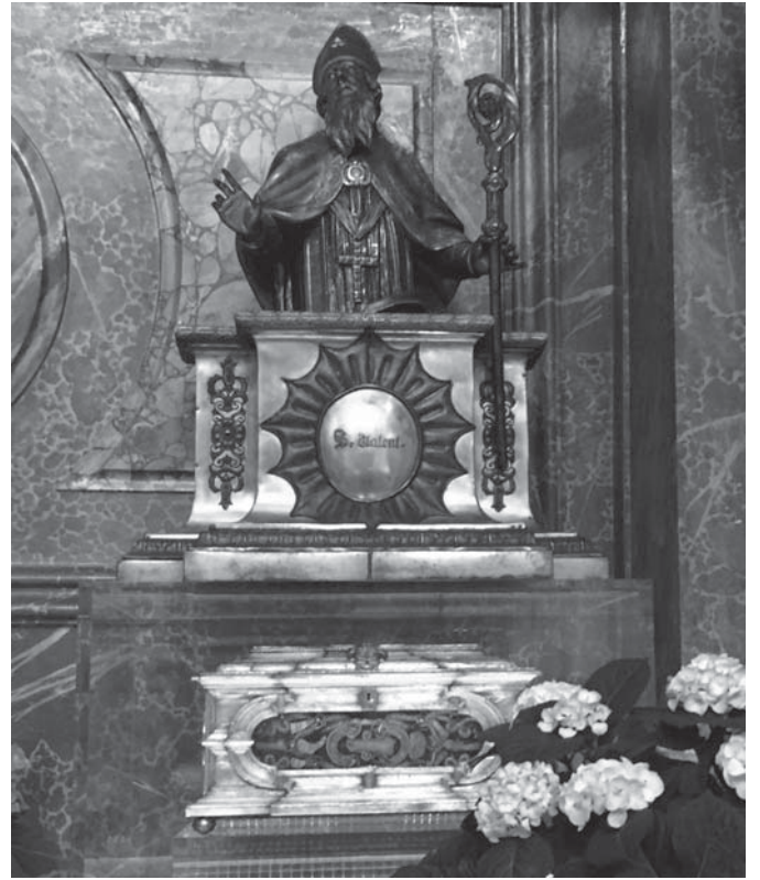
Reliquienschrein des Hl. Valentin im Passauer Dom

Einen Beitrag zur Biographie des Hl. Va-