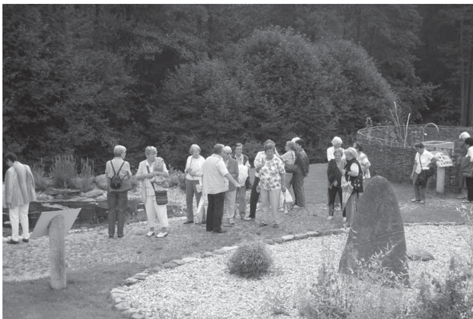
Ausflug zum Feng Shui-Kurpark in Lalling

Zahlreiche Aktionen ziehen sich als roter Faden seit der Gründung durch die Vereinsgeschichte, ergänzt durch neue, zeitgerechte Ideen, z.B. Gestaltung des Weltgebetstages