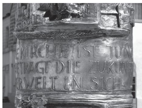
„Die Kirche ist jung. Sie trägt die Zukunft der Welt in sich.“ - Inschrift der Benedikt-Säule in Marktll

Doch: Mark Twain liebte seine Olivia über