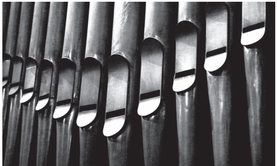
Foto: Peter Weidemann in: Pfarrbriefservice.de Fotos oben: Eigentum der Künstler