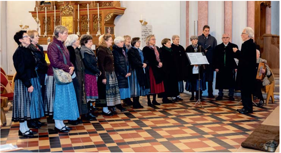
Preisträger des Zwieseler Fink singen im Gottesdienst