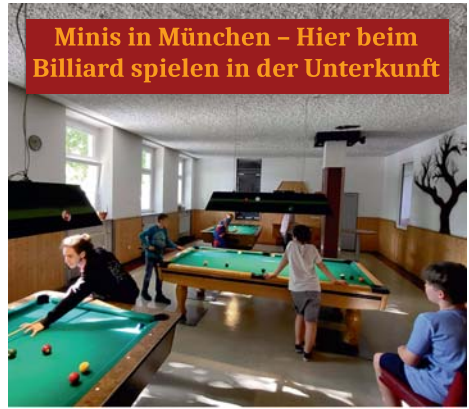
Minis in München – Hier beim Billiard spielen in der Unterkunft