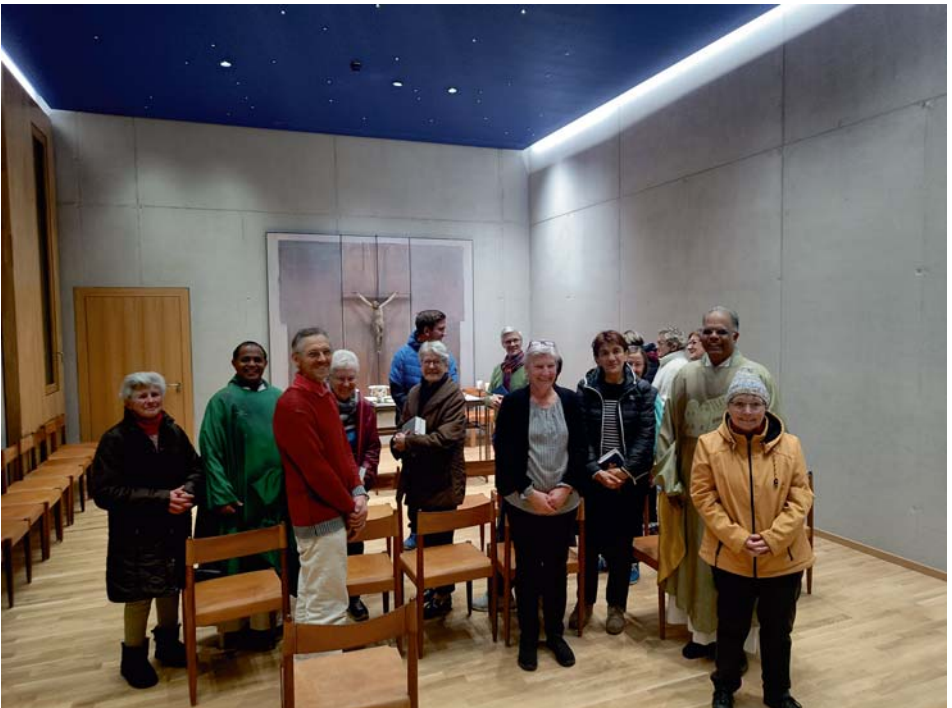
Die erste Werktagmesse in der Kapelle des Caritas-BBZ