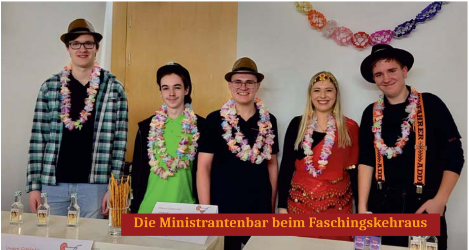
Die Ministrantenbar beim Faschingskehraus