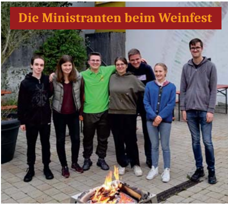
Die Ministranten beim Weinfest