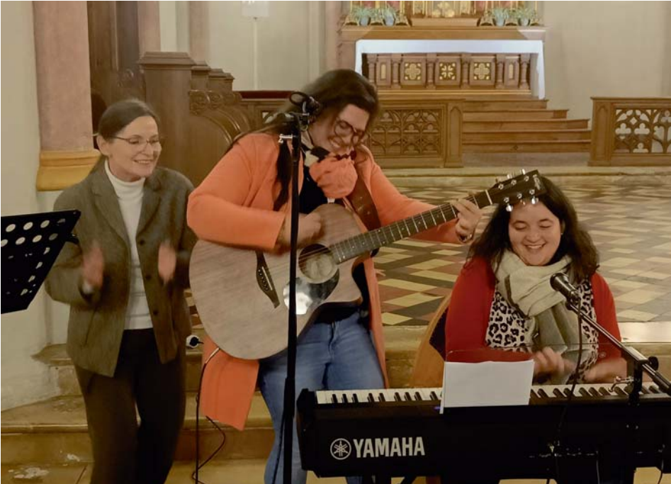
Mitglieder der Band