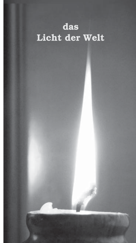
Text: Klaus Jäkel