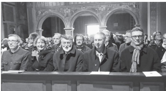
Viele Ehrengäste aus Politik und Kirche bewunderten die festlich geschmückte Pfarrkirche