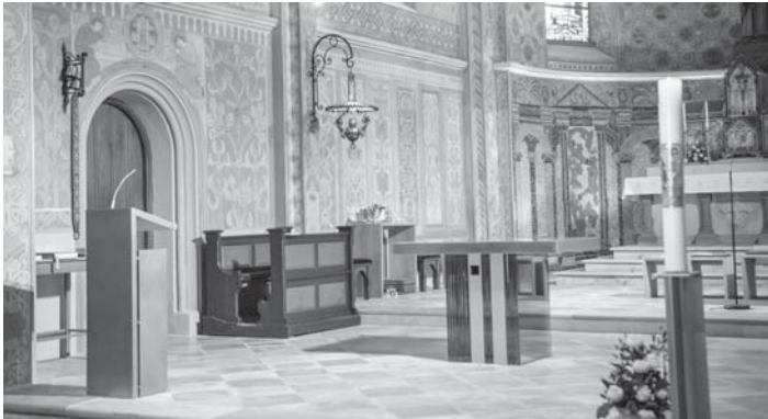
Ein Blick in den Altarraum mit dem neuen Ambo, Altar und Osterkerzenständer