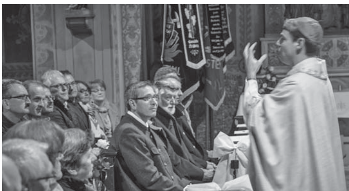
Bischof Oster ging während der Predigt durch die Bankreihen und sicherte sich so aufmerksame Zuhörer