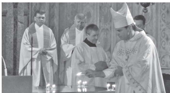
Schalen mit Weihrauch wurden vom Bischof entzündet, anschließend wird der Altar von Mitgliedern des Pfarrgemeinderates gereinigt und eingedeckt