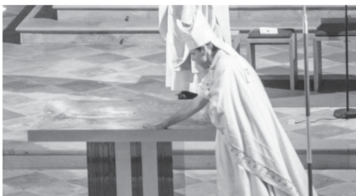
Der Bischof salbt den neuen Altar mit Chrisam