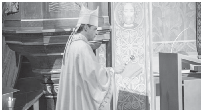
Der Bischof weiht den neuen Ambo